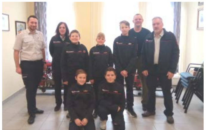
Die Jugendgruppe beim Wissenstest in Perg