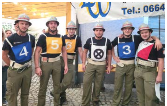
Bewerbsgruppe 1 beim Nassbewerb in Holzleiten und beim Kuppelcup in Obernstraß