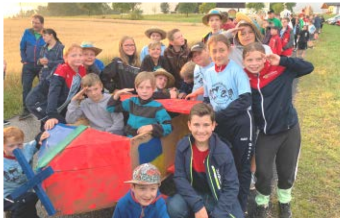
Jugendlager in Dimbach