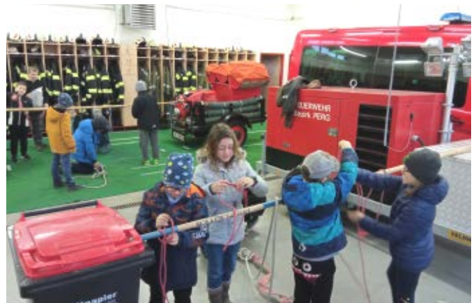
Knotenkunde im Feuerwehrhaus