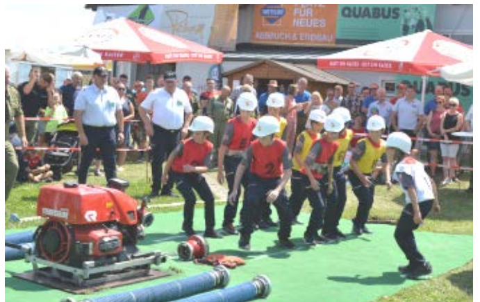
Jugendgruppe beim Ortschaftsbewerb