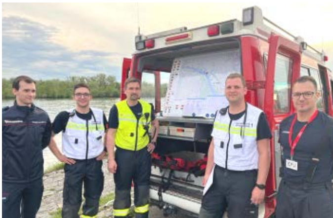
Große Donauübung in Au/Donau