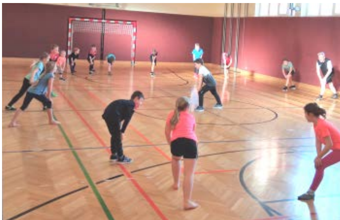
Spiel und Sport im Turnsaal