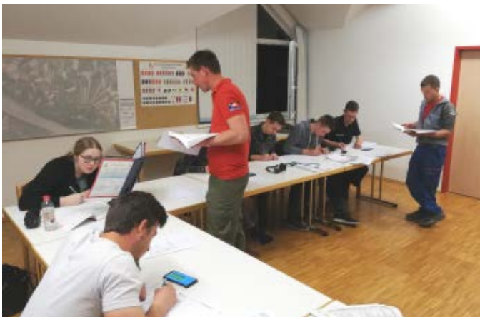
FuLA Ausbildung in Holzleiten

Über das gesamte Jahr verteilt fanden wieder Übungen und Schulungen statt, wobei das Highlight wahrscheinlich die große Donauübung Anfang Mai in Au/Donau war. Ausgangslage war die Havarie eines Schiffes in der Nähe der Donaubrücke in Mauthausen. Weiters wurde uns mitgeteilt, dass fünf Personen vermisst wurden. Treffpunkt der teilnehmenden Wehren war die Fa. Hydraulik Wurm, wo ein Einsatzstützpunkt eingerichtet wurde. Die Einsatzleitung oblag der FF Au/Donau mit Unterstützung der Einsatzführungsunterstützung Perg.