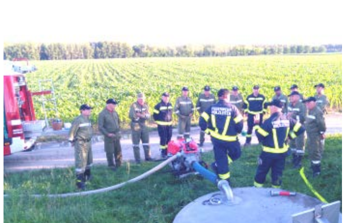
Gut besuchte Ü50 Schulungen und Übungen