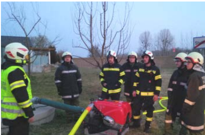
Brandeinsatzübung in Staffling

Die jährliche Pflichtbereichsübung der drei Gemeindefeuerwehren (Au/Donau, Naarn