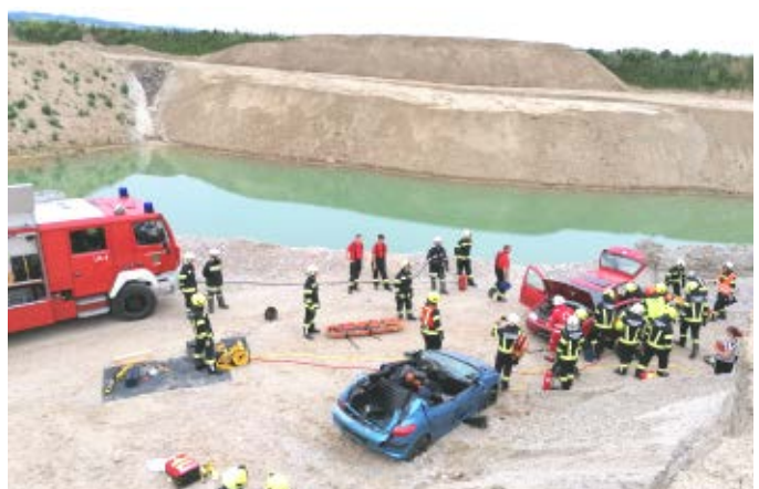
Übung in der Schottergrube