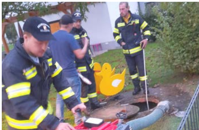
Löschbrunnen in Holzleiten