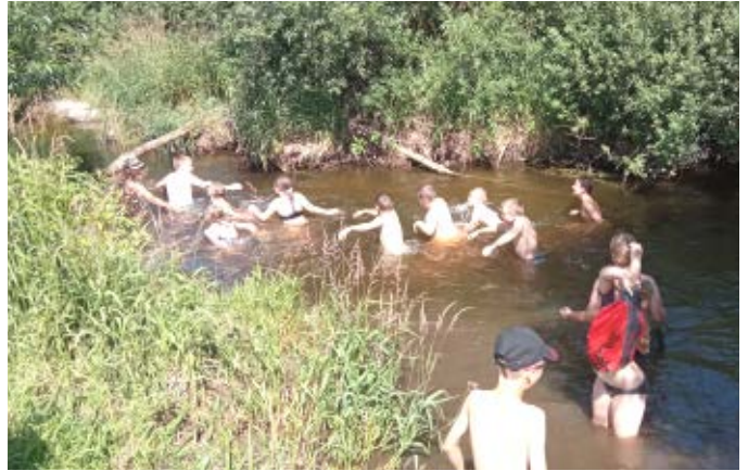
Bewerbslauf mit anschließender Abkühlung in der Naarn