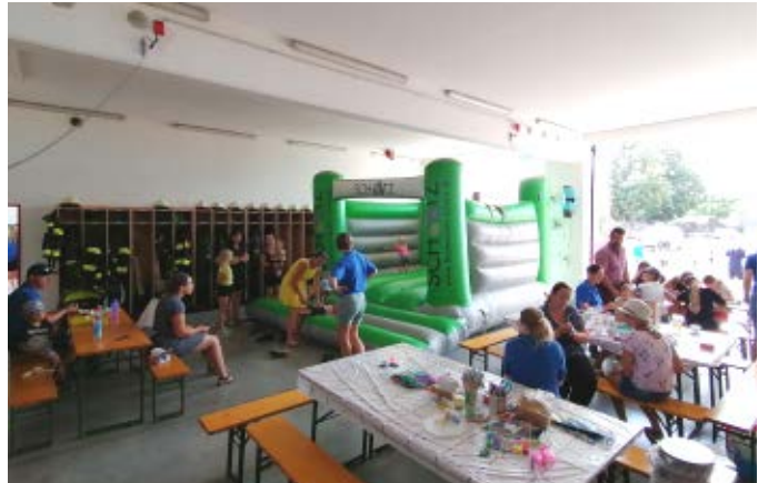
Impressionen vom Nassbewerb und Familiennachmittag