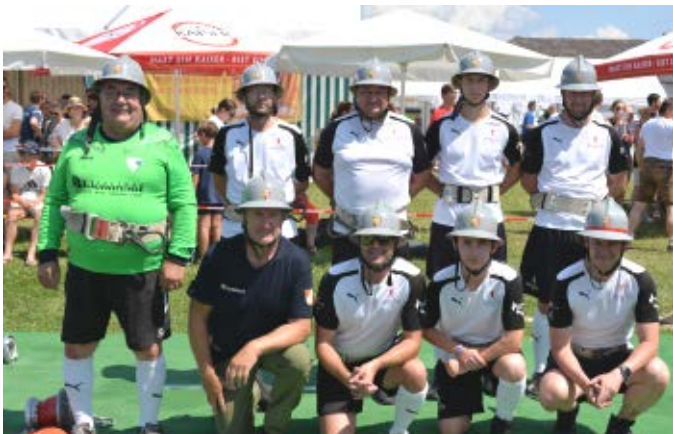
Gruppe DSG Union Metallbau Blauensteiner Naarn