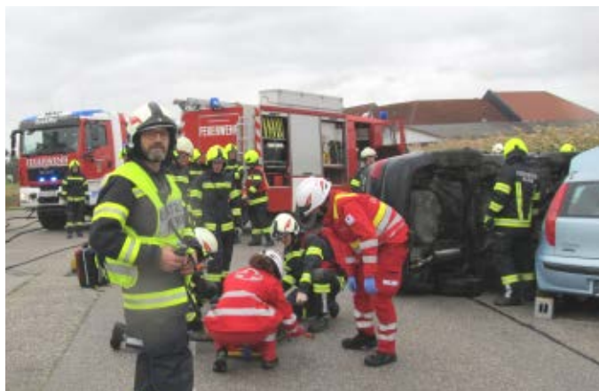
Pflichtbereichsübung in Schönau