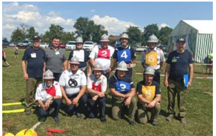
Auch die Bewerter stellen eine Gruppe