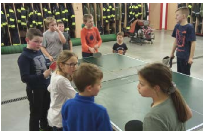
Spielenacht im Feuerwehrhaus